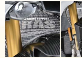
ラジエーターコアガード ラジエーター+OILクーラーセット 各¥30,300 (309-276-A00) Aタイプ AGRASロゴ有 (309-276-B00) Bタイプ AGRASロゴ無 ステンレス製、エッチング仕上げ 飛び石等からクーラーのコアを保護します。