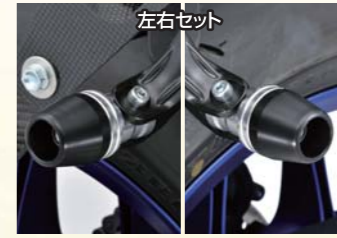
タンデムスライダー (アルミベース+ジュラコン) 各¥12,000 (341-264-000) ジュラコン/ホワイト (341-264-000B) ジュラコン/ブラック 方角の転倒時にタンデムスライダーが支点となり各部を保護します。 ※タンデムステップは使えません。