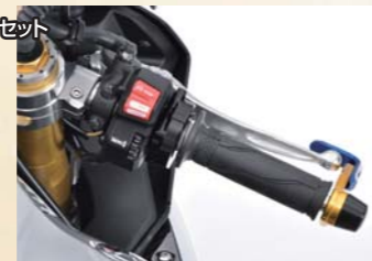
ハンドルSET (321-276-001) 各¥40,000 アルミ削り出し製 左右セット 垂れ角: 10°(ノーマル) 11° 高さ: ハンドルをクランプしている部分で純正と同じ。垂れ角分純正より下がります。 垂れ角分純正より下がります。 トップブリッジとハンドルを固定するステーを取り外せば自由に絞り角を設定することができます。 (ハンドルが車体に干渉しない範囲となります) ※ケーブル類は純正をそのまま使用できます。 ※純正トップブリッジに取付可能。