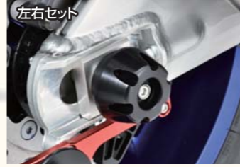
リアアクスルプロテクター (345-276-000) 各¥12,500 プロテクターサイズ: φ60 左右セット ジュラコン製 アルミ製シャフト使用 ※方角の転倒時に、アクスルシャフト部分及び、ブレーキまわりを保護します。