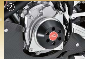
レーシングライダー ジェネレーター(アルミベース+ジュラコン) 各¥19,500