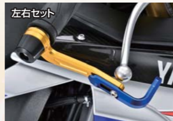
レバーガード 純正ハンドル用(301-276-***) 各¥20,000 当社製ハンドル用(321-273-***) 各¥20,000 アルミ削り出し製 左右セット 接触によるブレーキ事故を防ぐ目的でレース等で使用されている商品です。クラッチ側との左右セットとなっております。バーエンドにはジュラコンを装着する事で方角の転倒時のダメージを軽減します。 レバーに対してのクリアランスをお好みで調整可能です。 ※パーツごとにカラーを選択可能です。パーツ詳細およびカラー選択についてはお問い合わせください。