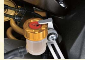
リザーバタンクキャップ(リア) (325-038-400*) 各¥4,800 アルミ削り出し製 ※*部分には色番が入ります。 シルバー(S) レッド(R) ブルー(B) ゴールド(G) ブラック(BK) チタン(T) ガンメタ(GM) ※純正リアブレーキマスターのリザーバタンク用