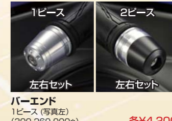
バーエンド 1ピース (写真左) 各¥4,200 (300-269-000*) ※*部分には色番が入ります。 シルバー(S) レッド(R) ブルー(B) ゴールド(G) ブラック(BK) チタン(T) ガンメタ(GM) サイズ: φ32×L35mm Weight: 56g アルミ削り出し製 左右セット 2ピース (写真右) 各¥5,200 (301-269-000*) ※前の*部分にはアルミの色番が入ります。 シルバー(S) レッド(R) ブルー(B) ゴールド(G) ブラック(BK) チタン(T) ガンメタ(GM) ※後ろの*部分にはジュラコンの色番が入ります。 ブラック(B) ホワイト(W) 例: 301-269-000BKB ベース: ブラック、ジュラコン: ブラック サイズ: φ32×L38mm アルミ削り出しのベースにジュラコン製のエンドを組み合わせたタイプ。ベース部分とジュラコン部分の色指定が可能です。左右セット