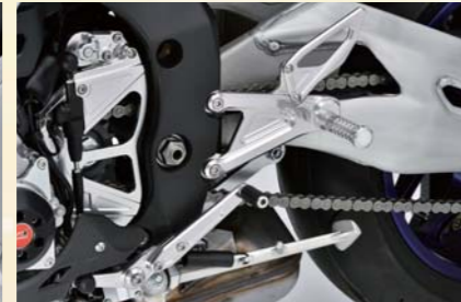
バックステップ (312-276-000) 各¥75,000 4ポジション UP: 30mm/40mm BACK: 15mm/25mm アルミ削り出し製 純正のブレーキスイッチがそのままご利用可能です。 ※ステップバーの組み替えも可能です。(MFJ-AIに限りです。) ※逆チェンジ可能