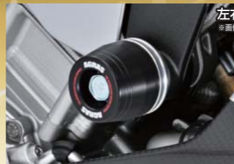
レーシングライダー フレーム(アルミベース+ジュラコン) 各¥10,000