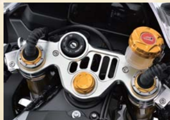
トップブリッジ (321-276-000) 各¥39,500 アルミ削り出し製 アルミ削り出しセンターナット付(カラー:シルバーのみ) ※ケーブル類は純正をそのまま使用できます。 ※ハンドルバーの取付角度によっては車体と干渉しますので干渉しない位置で取付けてください。