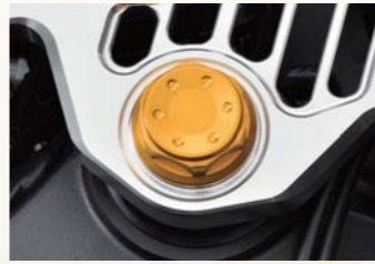
センターナット (346-027-100*) 各¥4,000 アルミ削り出し製 サイズ: M27×P1.0 ※*部分には色番が入ります。 シルバー(S) レッド(R) ブルー(B) ゴールド(G) ブラック(BK) チタン(T) ガンメタ(GM)