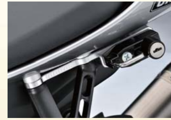
ヘルメットホルダー (603-276-000**) 各¥9,500 アルミ削り出し製 ヘルメットロックと専用ステーのセット ※**部分には色番が入ります。 (SS) アルミステア/シルバー ヘルメットロック/メック (SB) アルミステア/シルバー ヘルメットロック/ブラック (BS) アルミステア/ブラック ヘルメットロック/メック (BB) アルミステア/ブラック ヘルメットロック/ブラック