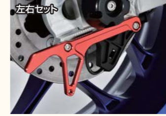
リアスタンドフック (353-276-000*) 各¥12,000 アルミ削り出し製 左右セット ※*部分には色番が入ります。 シルバー(S) レッド(R) ブルー(B) ゴールド(G) ブラック(BK) チタン(T) ガンメタ(GM) スタンドフック取付部分を利用して取付けます。 丸受けタイプのレーシングスタンドがご利用になれます。