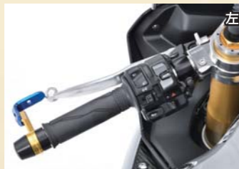
トップブリッジ&ハンドルSET (321-276-002) 各¥78,500 トップブリッジ&ハンドルのセット