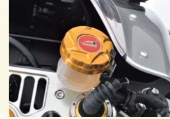
リザーバタンクキャップ(フロント) (325-052-400*) 各¥5,000 アルミ削り出し製 ※*部分には色番が入ります。 シルバー(S) レッド(R) ブルー(B) ゴールド(G) ブラック(BK) チタン(T) ガンメタ(GM) ※純正リアブレーキマスターのリザーバタンク用