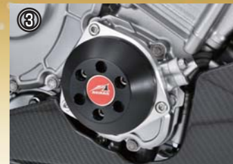
レーシングライダー クラック(アルミベース+ジュラコン) 各¥18,500 (342-276-001) ジュラコン/ホワイト (342-276-002) ジュラコン/ブラック (342-276-002B) ジュラコン/ブラック ※エンジン左側、クラッチケースカバーのボルトと共締めで取付けます。