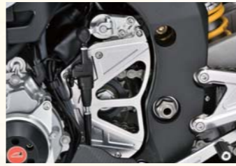
スプロケットカバー (347-276-000) 各¥32,000 アルミ削り出し製 ※シフトシャフトホルダー付属 純正同様にスプロケットを覆うような形状としています。チェーンスラッジ等でエンジンが汚れる心配がありません。

*品番の*印のところにはジュラコンの色番号が入ります。白の場合は色番号無しで、黒の場合はBになります。赤色の*印はレーシングライダーのジュラコンのロゴ有り無しを選択いただけます。ロゴ有りの場合はXになります。