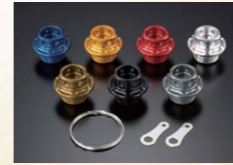
オイルフィルターキャップSET (454-027-300*) 各¥4,500 ※*部分には色番が入ります。 シルバー(S) レッド(R) ブルー(B) ゴールド(G) ブラック(BK) チタン(T) ガンメタ(GM) サイズ: M27×P3.0 アルミ削り出し製 ワイヤリング用のドリルホールを開けてあります。 専用ステンレス製ワイヤーリンク(2個)+ワイヤーを付属したオールインワンパッケージ。 フィルターキャップのドレスアップやレース出場の際に!