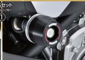
(342-276-000) ジュラコン/ホワイト (342-276-000B) ジュラコン/ブラック (342-276-000X) ジュラコン(ロゴ有)/ホワイト (342-276-000BX) ジュラコン(ロゴ有)/ブラック