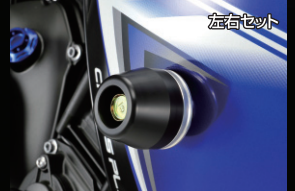
レーシングライダー

アルミ削り出し、アルマイト仕上げ。ブレンボ製、2POTキャリパー専用。 ※ブレーキホースは必ず現車に取り付けた状態で長さを確認してください。