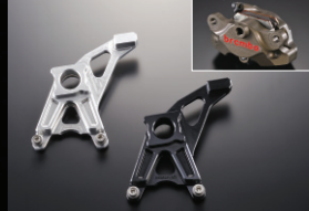
リアキャリアサポート

■Aタイプ AGRASロゴ有 ■Bタイプ AGRASロゴ無 ステンレス製、エッチング仕上げ。飛び石等からクーラーのコアを保護します。