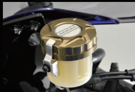
リザーバタンクキャップ

カラー:ホワイト、ブラック フレームタイプ(左右)+クラックBタイプ+オイルポンプBタイプのセット