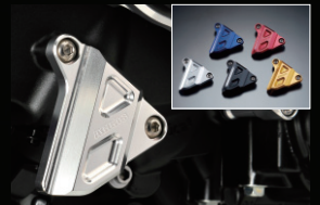
クラッチリリースアームカバー

カラー:シルバー、レッド、ブルー、ゴールド、ブラック、チタン ブレーキマスターのリザーバタンクに取付可能です。 サイズ:M52×P4.0