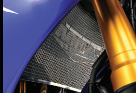
ラジエーターコアガード

アルミ削り出し、アルマイト仕上げ。削り出しとすることで、質感の向上が図れます。アルミセンターナット付き。