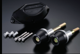
レーシングライダー

カラー:ホワイト、ブラック フレームタイプ(左右)+オイルポンプAタイプのセット