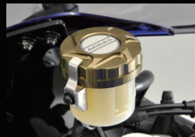
マスターシリンダーキャップ

カラー:ホワイト、ブラック フレームタイプ(左右)+クランクBタイプ+オイルポンプBタイプのセット