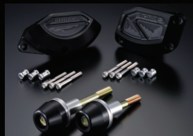
レーシングスライダー

カラー:ホワイト、ブラック フレームタイプ(左右)+クランクAタイプ+オイルポンプAタイプのセット