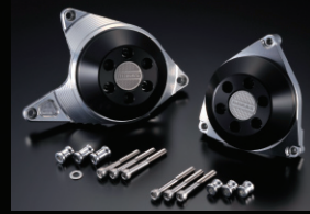
レーシングスライダー

カラー:ホワイト、ブラック フレームタイプ(左右)+オイルポンプBタイプのセット