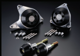
レーシングスライダー