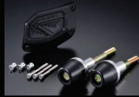
レーシングスライダー