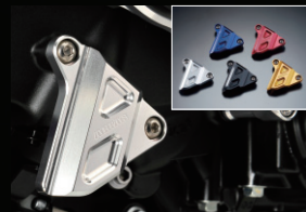
クラッチリアアームカバー

カラー:シルバー、レッド、ブルー、ゴールド、ブラック、チタン アルミ削り出し製、アルマイト仕上げ。 ブレーキマスターのリザーバータンクに取付可能です。 サイズ:M52×P4.0