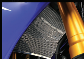
ラジエーターコアガード

アルミ削り出し、アルマイト仕上げ。 削り出しとすることで、質感の向上が図れます。 アルミセンターナット付き。