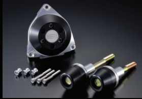
レーシングスライダー