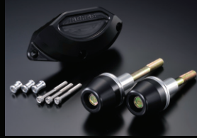
レーシングスライダー

カラー:ホワイト、ブラック フレームタイプ(左右)+オイルポンプAタイプのセット