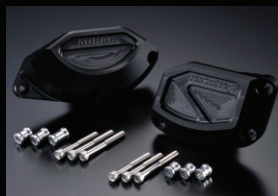
レーシングスライダー