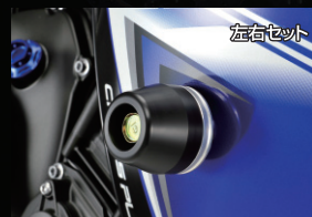
レーシングスライダー

アルミ削り出し、アルマイト仕上げ。 プレンボ製、2POTキャリア専用。 ※ブレーキホースは必ず現車に取り付けた状態にて長さを確認してください。 プレンボキャリア プレンボ削り2POTキャリア-84mmピッチ