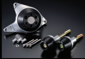
レーシングスライダー

カラー:ホワイト、ブラック エンジン右側のオイルポンプカバーのボルトと共締めで取り付けます。 ※走行条件によりバンク角が損なわれる場合がございます。